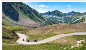
Per festeggiare il decennale, la 20.000 Pieghe torna sulle Dolomiti

Per festeggiare il decimo compleanno, la 20.000 Pieghe torna sulle Dolomiti, una delle aree più ammirate e frequentate dai motociclisti, autentica palestra per gli amanti della guida più impegnativa. L'ormai classico raid aveva già avuto come punto di riferimento Tesero e la Val di Fiemme e, per l'edizione 2018, in calendario dal 13 al 17 giugno, proporrà di nuovo l'accogliente e apprezzatissimo Hotel Shandranj, che sarà anche il quartier generale della manifestazione.