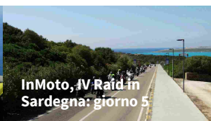
InMoto, IV Raid in Sardegna: giorno 5