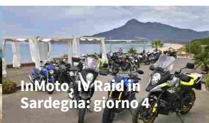
InMoto, IV Raid in Sardegna: giorno 4