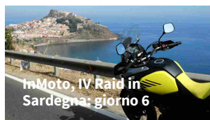
InMoto, IV Raid in Sardegna: giorno 6